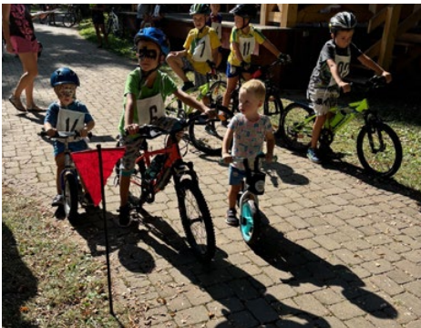
Na záver prázdnin zorganizovali poslanci cyklistické preteky pre deti.