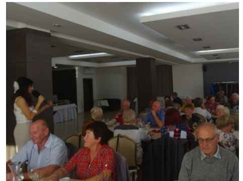
Koncert pre seniorov pri príležitosti „Mesiaca úcty k starším.“