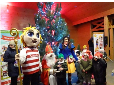
Príchodu Mikuláša predchádzal koncert „Usmievanky“ už vo vianočnom duchu.