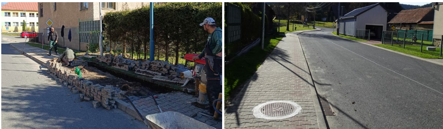
Rekonštrukcia chodníka na ulici Lesnej.