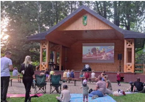
Letné premietanie rozprávok a filmov v miestnom parku.