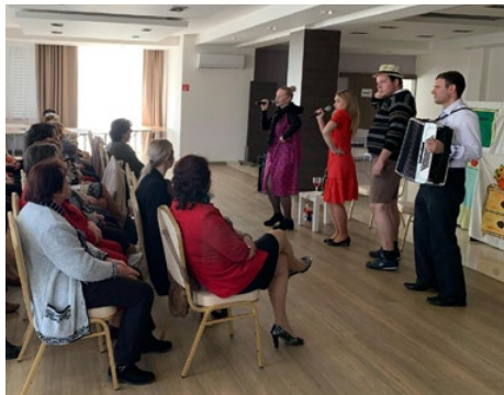
Divadelníci z Prešova spríjemnili druhú májovú nedeľu našim matkám.