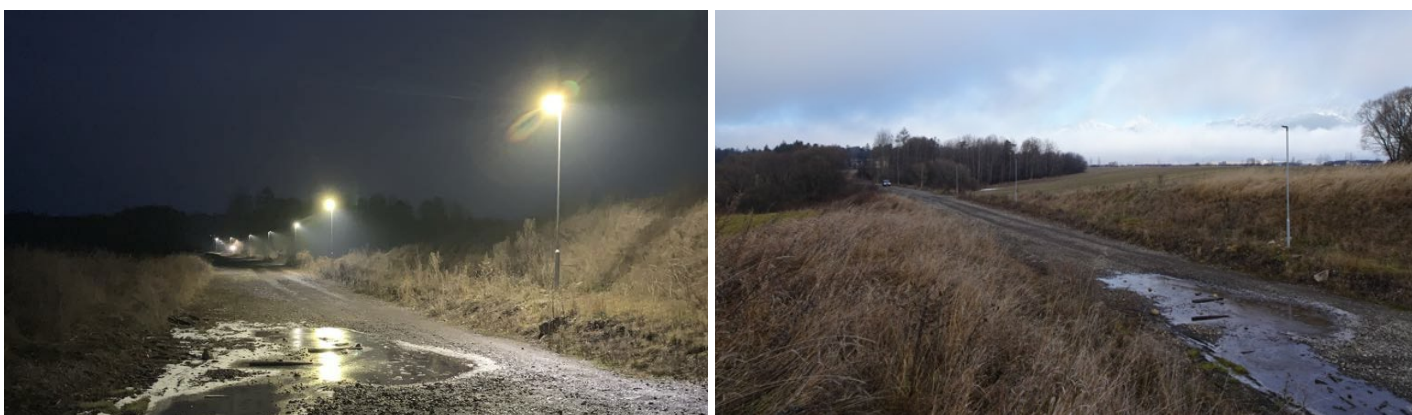
Nové osvetlenie na ceste do kúpeľov.