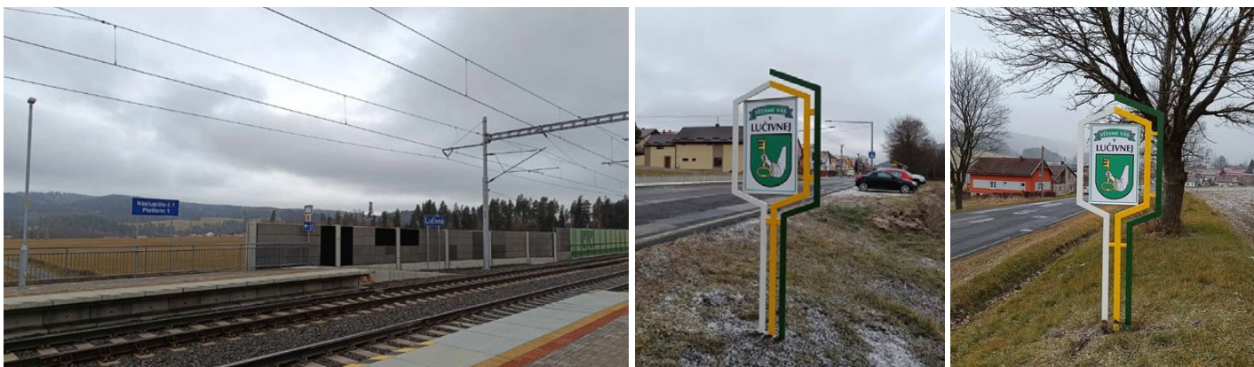
Nová železničná stanica.