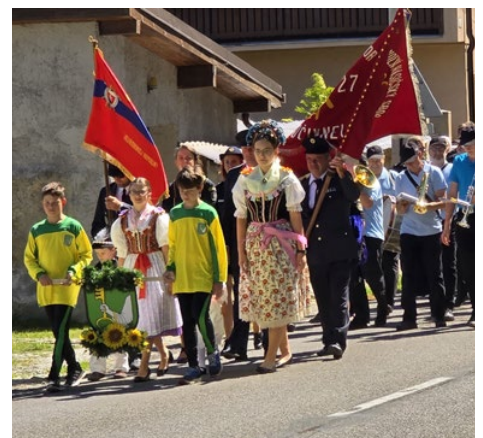
Ekumenické stretnutie a oslavy Cyrila a Metoda.