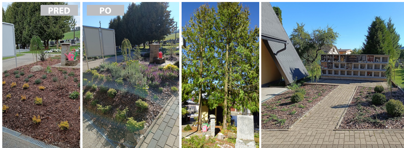
Nová výsadba na cintoríne nahradila staré tuje