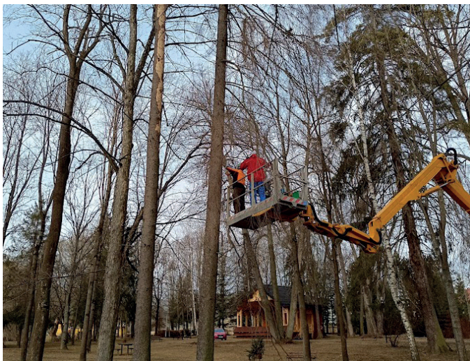
Výrub vyschnutých stromov v parku