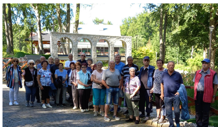
Výlet členov klubu dôchodcov na Prednej Hore