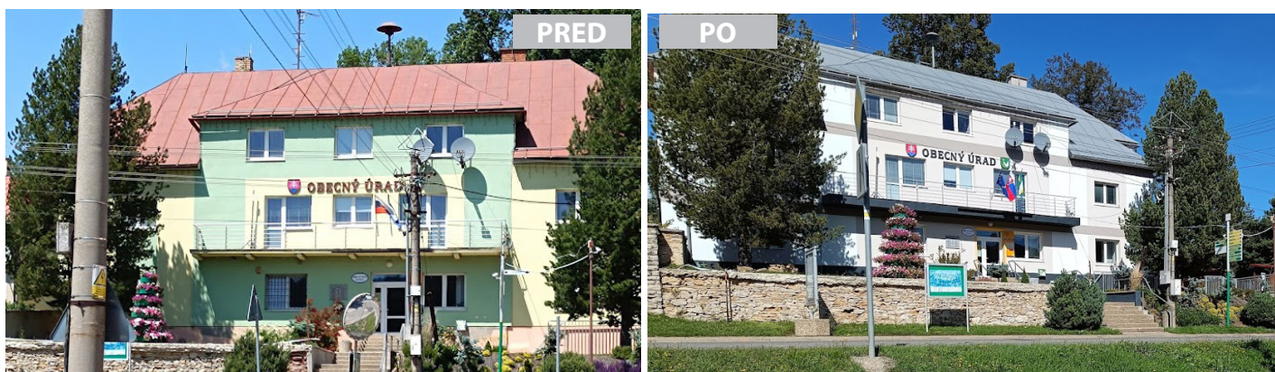
Náter strechy a obnova fasády na budove obecného úradu