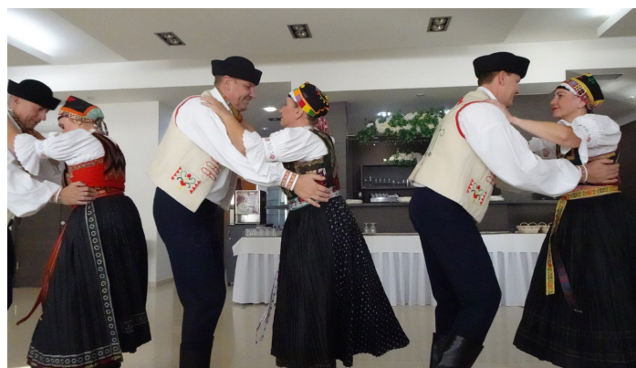
Mesiac úcty k starším