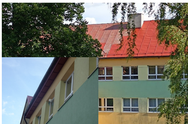
Náter strechy a oprava podbitkov na budove školy