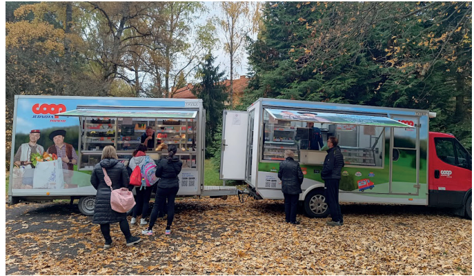
Pojazdná predajňa potravín COOP JEDNOTA v Kúpeľoch Lučivná