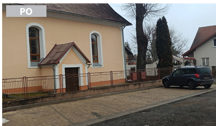
Novovybudované parkovisko pri evanjelickom kostole