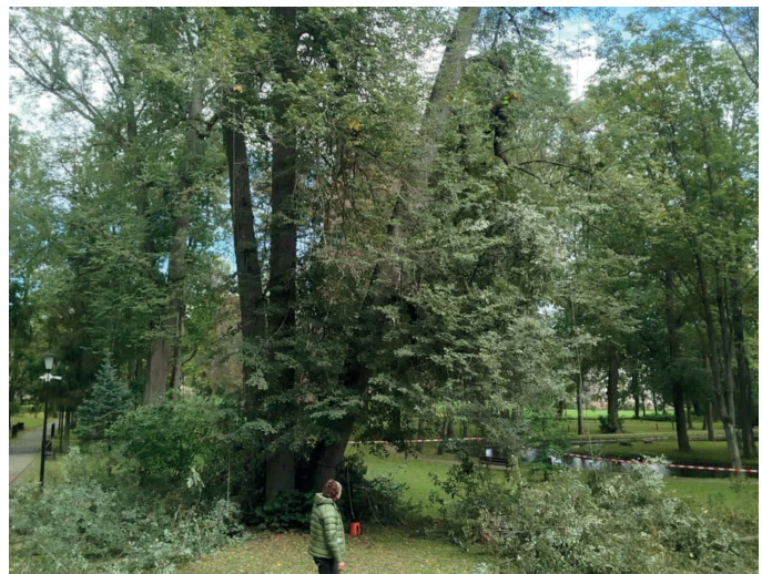
Ošetrovanie starých stromov v parku