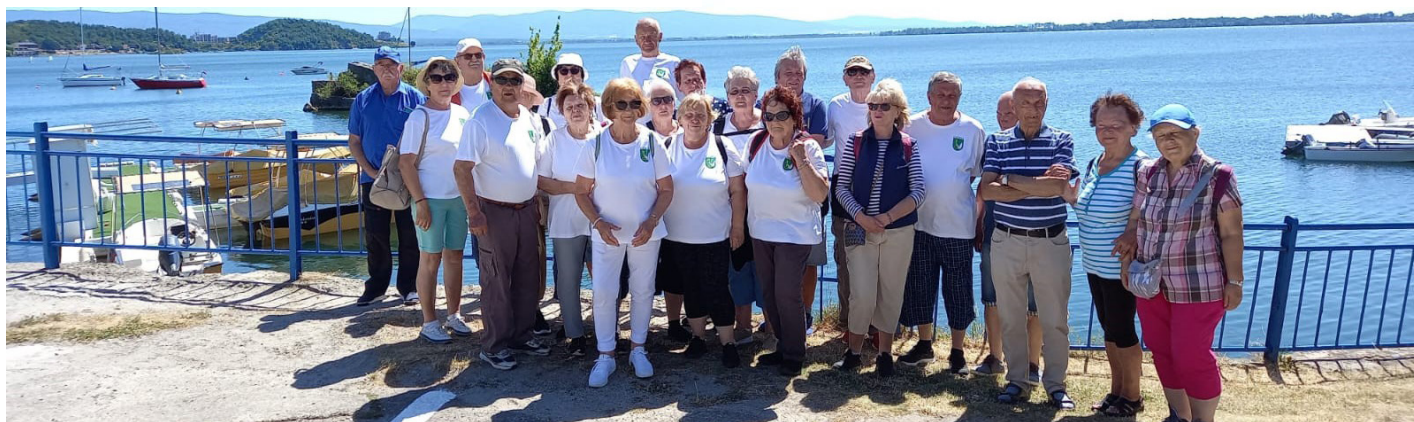
Výlet členov klubu dôchodcov na Zemplínskej Šírave