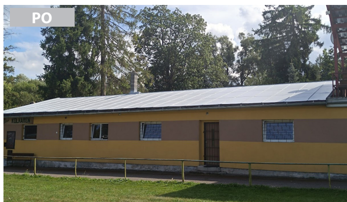
Náter strechy na budove kolkárne