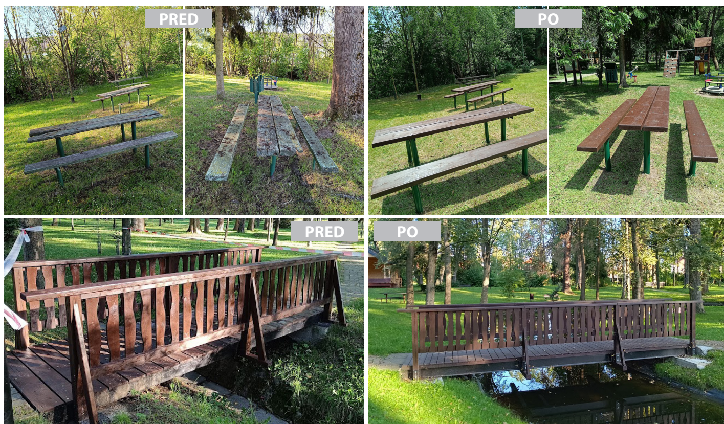
Nové lavičky a mostíky v miestnom parku a pri budove kolkárne