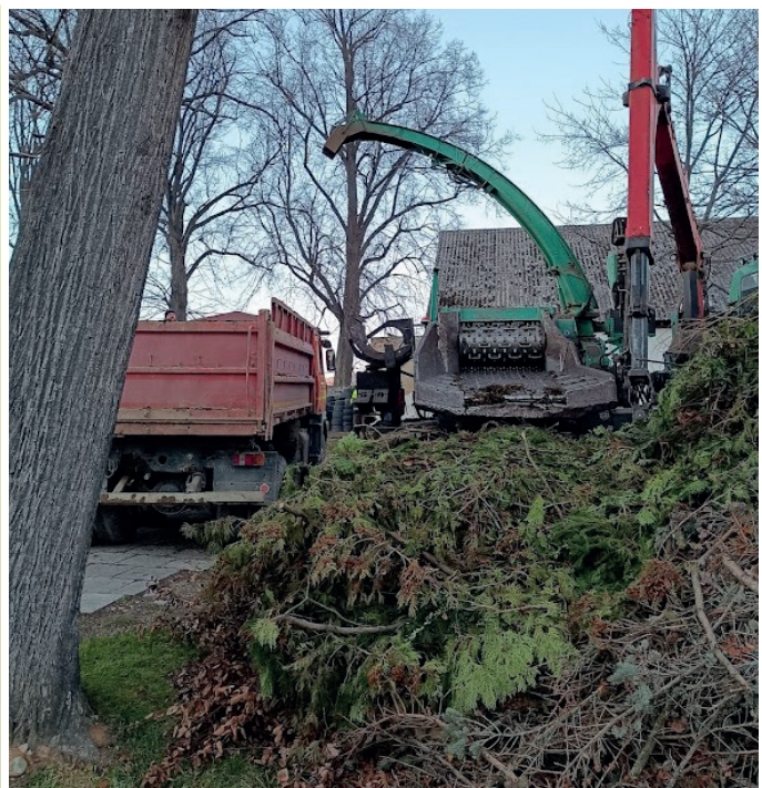
Zhodnocovanie odpadu - konárov na drevnú štiepku