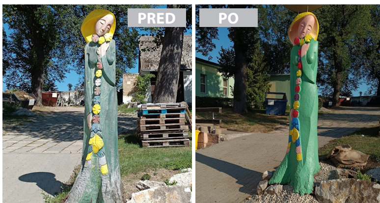
Obnova sochy vo dvore obecného úradu