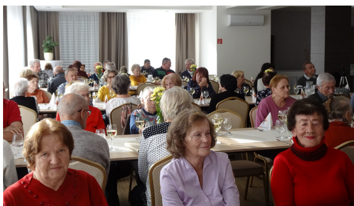
Mesiac úcty k starším